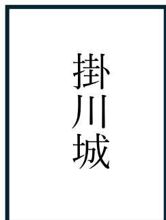
「掛川城」文字配置イメージ